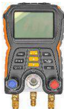
Р и с у н о к 1 – Общий вид измерителей давления

Схема пломбировки от несанкционированного доступа и место нанесения знака поверки представлены на рисунке 3.